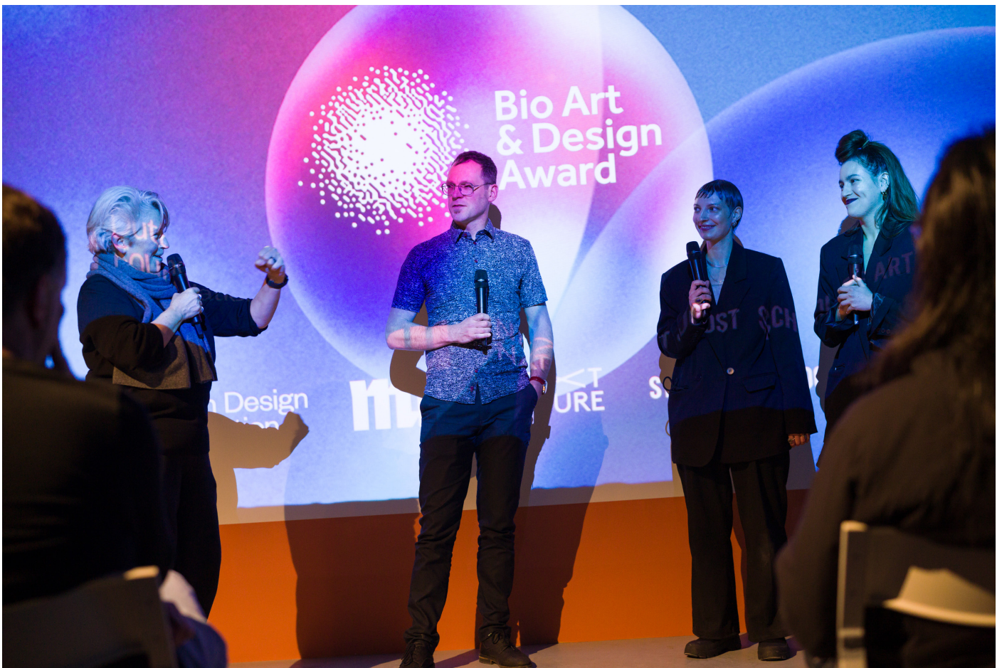
BAD Awards, MU Hybrid Art House

Een artistiek-wetenschappelijk onderzoek waarin zij zich afvragen hoe zij de productie van kennis kunnen transformeren.