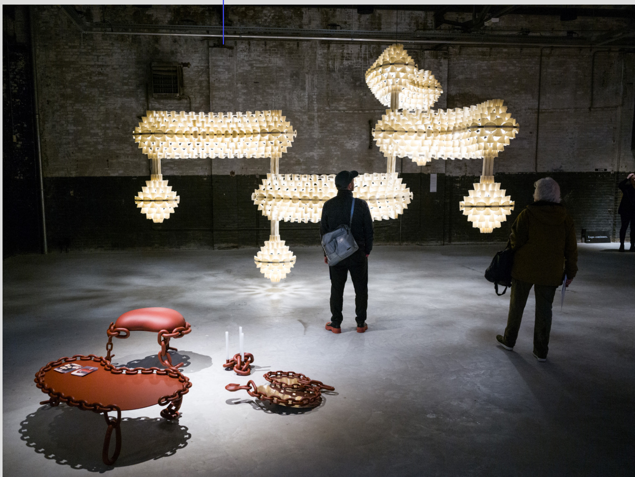
Kazerne © Boudewijn Bollmann