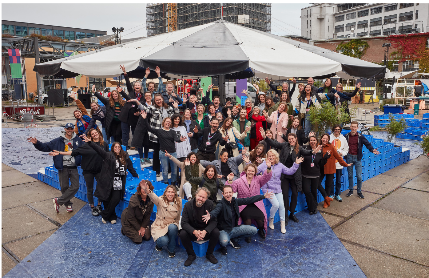
Team Dutch Design Foundation

In de afgelopen jaren heeft DDF zich ontwikkeld tot een organisatie met een brede waaier aan activiteiten en verantwoordelijkheden. In de kern van al deze activiteiten en verantwoordelijkheden ligt besloten dat we, vanuit een bewustzijn van de essentiële rol van creatieven bij het vormgeven van de wereld van morgen, de kracht en positie van ontwerpers helpen versterken. Daarom tonen wij hun werk en visies en stimuleren we talenten. We brengen we op alle mogelijke manieren en in alle denkbare vormen verbindingen tot stand tussen ontwerpers en bedrijven, organisaties, overheden en burger en werken aan urgente en relevante vraagstukken.