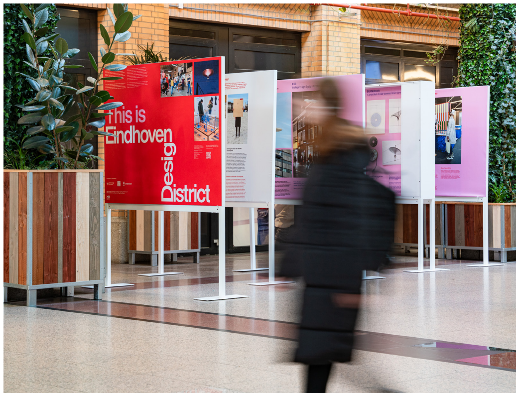
Eindhoven Design District expo, Heuvelgalerie

EDD is een initiatief van gemeente Eindhoven, DDF en Eindhoven365 om design en technologie in Eindhoven een groter podium te bieden en design thinking te stimuleren bij bedrijven en overheden. In de expositie van EDD 2023 vonden bezoekers van DDW volop inspiratie om design in Eindhoven zelf te ervaren door de aangesloten projecten te bezoeken of een designroute te lopen. De expositie vond dit jaar plaats in een winkelcentrum in het hart van Eindhoven. Het nodigde niet alleen tijdens DDW maar het hele jaar door zowel de gerichte bezoeker als de argeloos winkelende voorbijganger uit om design in Eindhoven te ontdekken.