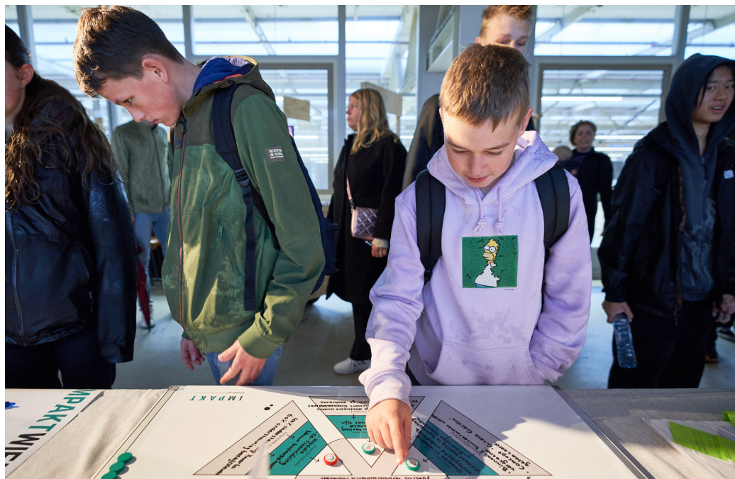
DDW Young