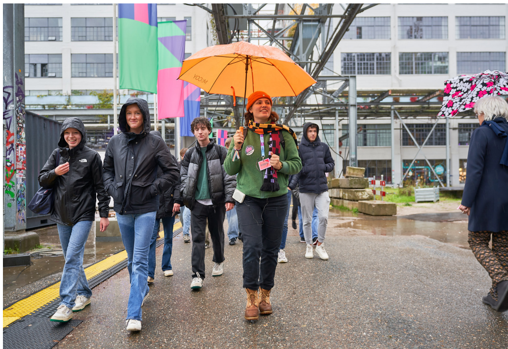
DDW Young tour