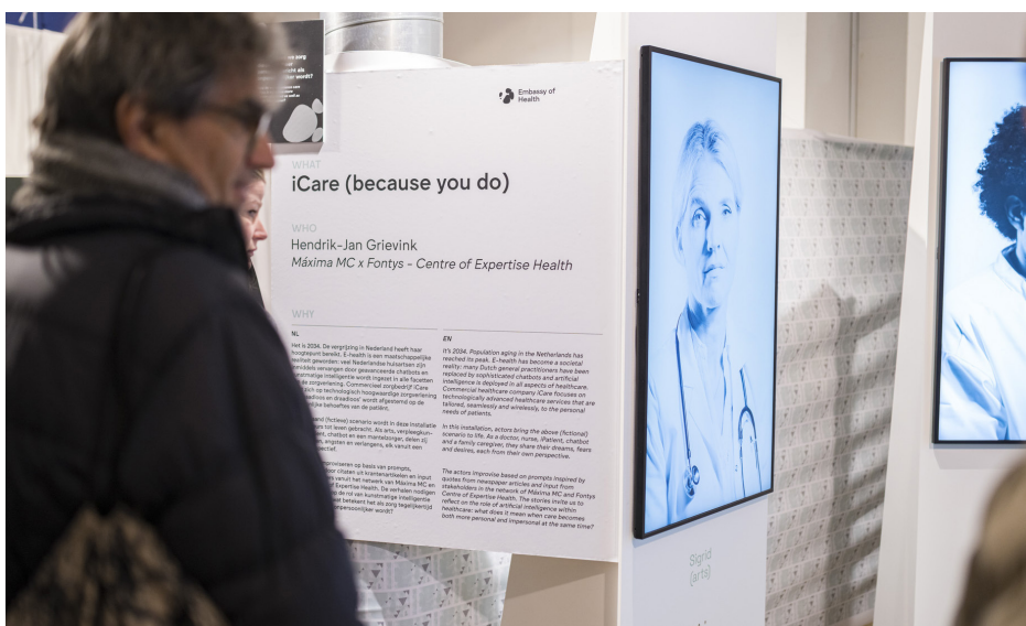
Embassy of Health

Zorgkosten, verzekeringspremies, risicoberekeningen. We zijn gewend om op een hele economische manier over onze gezondheid en zorg te denken. In termen van geld, betalingen, harde munt: valuta. Maar het woord valuta is terug te leiden naar het Latijnse 'valère'. Dat betekende destijds zoveel als 'gezond of sterk zijn'. Met die betekenis in het achterhoofd werd in 2023 in de Embassy of Health de vraag gesteld of we onze gezondheid kunnen zien als een waarde op zich. Partners verkenden hoe we onze gezondheid kunnen sparen, laten stromen, kunnen uitwisselen en met elkaar kunnen delen. Bezoekers kregen een voorproefje van hoe ontwerp- en verbeeldingskracht bijdragen aan een (her)waardering van gezondheid als ons grootste goed.