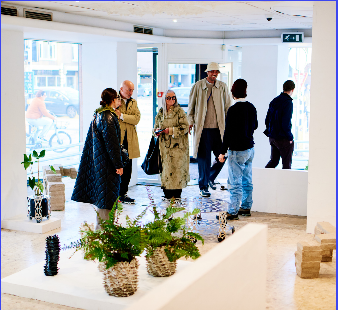
Housewest, Woensel