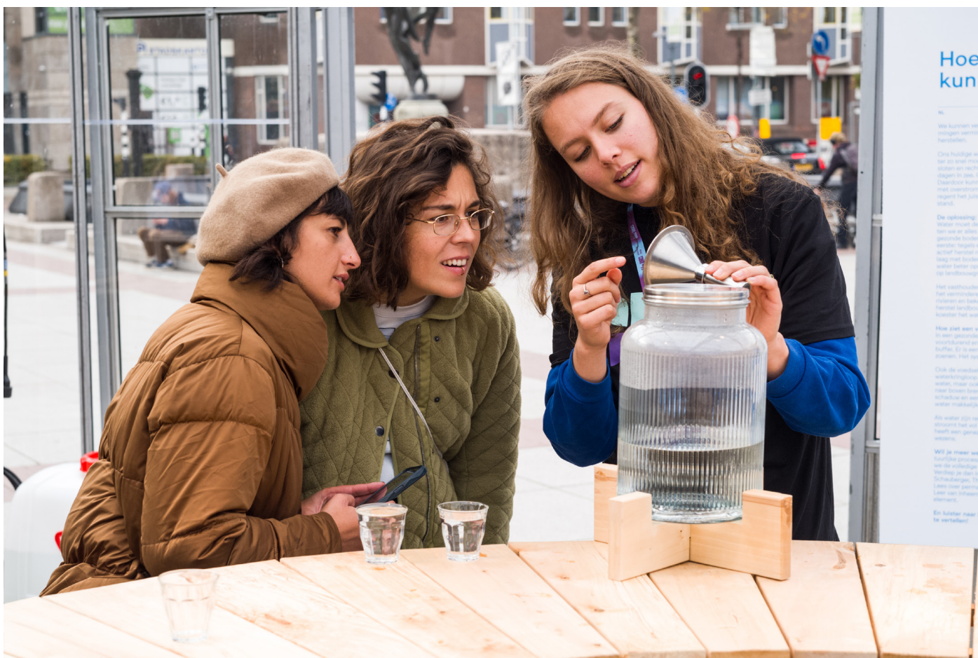
Embassy of Water

7. Embassy of Water. Water neemt veel verschillende vormen aan, legt een reis af van vele kilometers door de lucht, over land, door de bodem en in de zee. We hebben als mens deze natuurlijke watercyclus grondig verstoord met onder andere wateroverlast als gevolg. Maar daar is iets aan te doen: we kunnen de watercyclus herstellen. De Embassy of Water neemt hierin het voortouw en zoekt met ontwerpers, waterpartners en experts naar praktische oplossingen en een andere denkwijze over water. We willen af van het mensgericht denken (onttrekken, gebruiken en lozen van water) en toe naar een levensgericht denken: we lenen, hergebruiken en herstellen water.