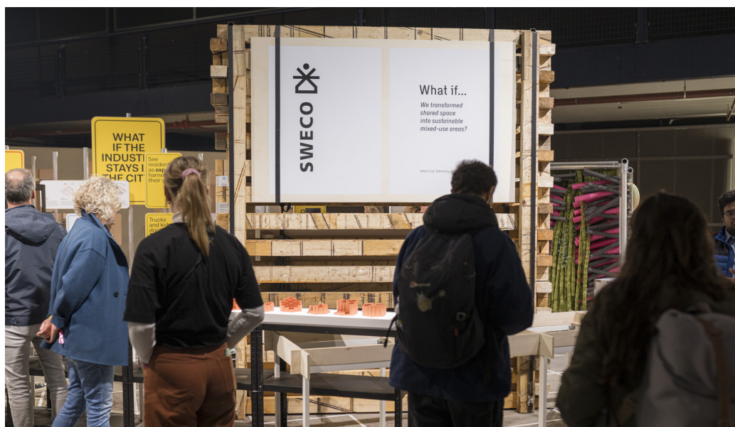
What if Lab x Sweco

Dit lab is een tweejarig programma (2023-2024) waarin wordt samengewerkt met het Erasmus Huis Jakarta. Nederlandse en Indonesische ontwerpers werken in dit lab samen om een prototype te ontwerpen voor buurten in Indonesië die nu nog geen toegang hebben tot gedeelde gemeenschapsruimtes. Tijdens DDW24 zijn de uitkomsten van dit Lab te zien in Eindhoven.