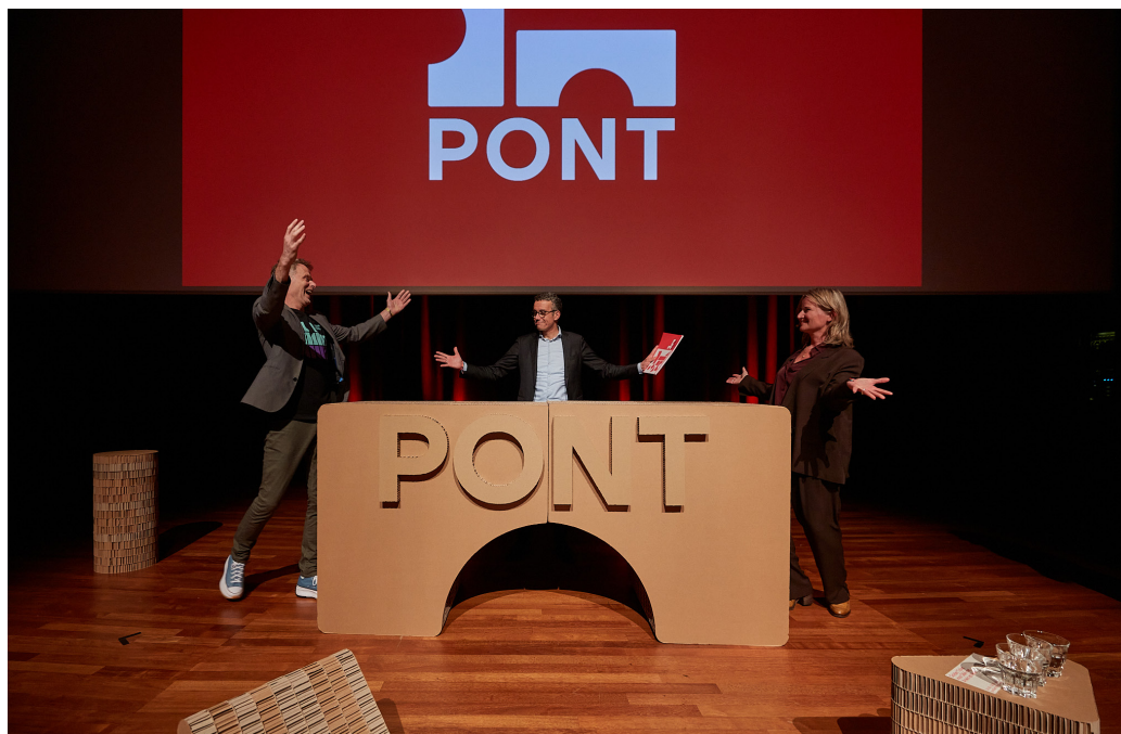
Lancering PONT op DDW23

Sinds 1 april 2024 is het PONT-team op volle sterkte. Bij 10 tot 15 ontwerppraktijken gaan 'impactversterkers' aan de slag om de praktijken te coachen en zo meer impact te realiseren met hun ontwerpende aanpak. Daarnaast starten 10 onderzoeken in de Werkplaats. Onderwerpen zijn onder meer taal, inkoopvoorwaarden en vraagarticulatie.