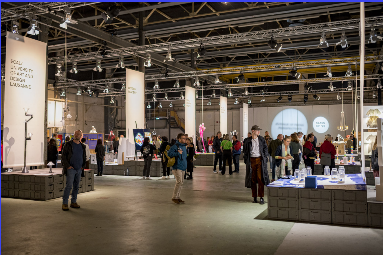
Class of '23, Klokgebouw

Op DDW bieden we maar al te graag het podium aan jonge talenten. Het is de nieuwe generatie ontwerpers die de toekomst mede vorm gaat geven. We tonen niet alleen hun werk maar helpen ze ook bij het leggen van verbindingen met opdrachtgevers, afnemers, mogelijke samenwerkingspartners en de internationale media. Dat doen we niet alleen voor jonge ontwerpers uit Nederland, ook voor internationaal talent.