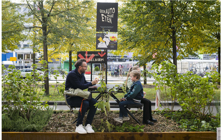
Embassy of Mobility

Naast het thema en de missies bood de introductiehal de bezoeker een voorproefje van de breedte van ontwerpen die op DDW te zien waren. DDF is er immers voor de volle breedte van het ontwerpveld: van individueel tot systemisch en van conceptueel tot toegepast. Binnen die context onderscheiden we vijf verschillende ontwerp-perspectieven: