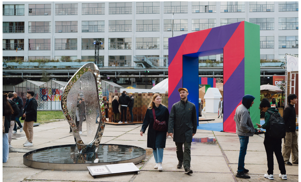
Ketelhuisplein, Strijp-S

Dutch Design Week (DDW) is een belangrijk vliegwiel van Dutch Design Foundation (DDF). Hét jaarlijkse negendaagse festival waarin we het ontwerp van de toekomst en de toekomst van ontwerp laten zien. Van 21 tot en met 29 oktober 2023 presenteerden meer dan 2.000 ontwerpers en studio's uit binnen- en buitenland zich op 400 evenementen, verspreid over 130 locaties in Eindhoven. Zij riepen de ruim 300.000 bezoekers op om huidige toekomstscenario's onder ogen te zien en nieuwe perspectieven te omarmen. Steeds weer droegen zij dezelfde optimistische en verbindende boodschap uit: samen kunnen we een betere toekomst vormgeven!