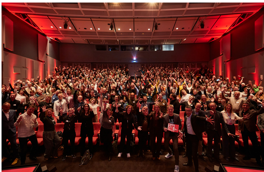
DDW 2023, PONT

Samen zorgen de medewerkers van DDF ieder jaar dat de vele Labs, Embassies, Awards, andere samenwerkingen en natuurlijk Dutch Design Week er komen. Zij zijn de motor achter al onze programma's en activiteiten.