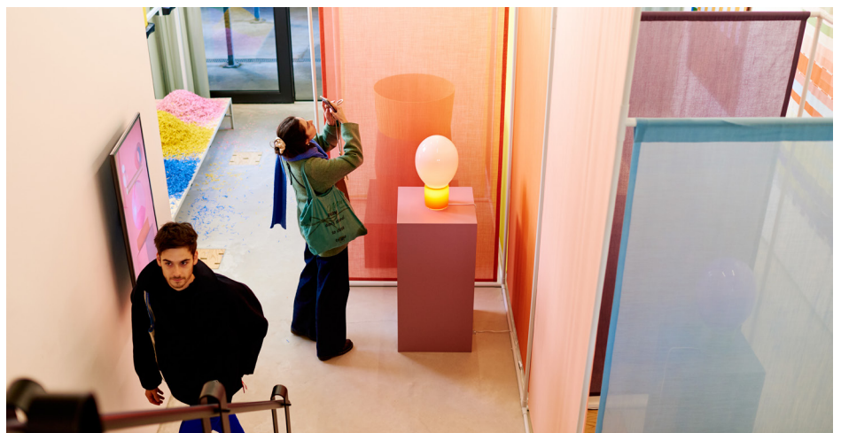
Raw Color, Strijp-R

Bij het aangaan van contracten bespreken wij expliciet dat wij van hen verwachten dat zij de Fair Practice Code handhaven. Dat deze werkwijze resultaat heeft, blijkt wel uit het feit dat ook in 2023 deze expliciete bepaling in het contract voor een aantal partners aanleiding was om hierover actief het gesprek met ons aan te gaan.