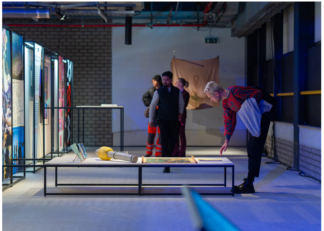
Expo DDA23, Microlab Hall

Al 21 jaar organiseert Dutch Design Foundation de Dutch Design Awards, dé prijs voor het beste Nederlandse ontwerp. Daarnaast reiken we sinds 2021 in samenwerking met MU Hybrid Art House, BioArt Laboratieries en Next Nature de Bio Art & Design (BAD) Awards uit.