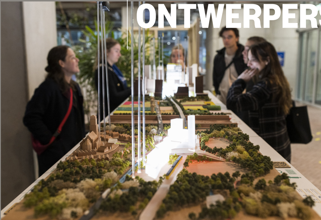
Embassy of Mobility

WE ZIJN OPTIMISTISCH, MAAR ERKENNEN DE HUIDIGE VRAAGSTUKKEN EN DE ERNST DAARVAN. WIJ GELOVEN IN DE VOORWAARTSE DENK- EN DOEKRACHT VAN ONTWERPERS