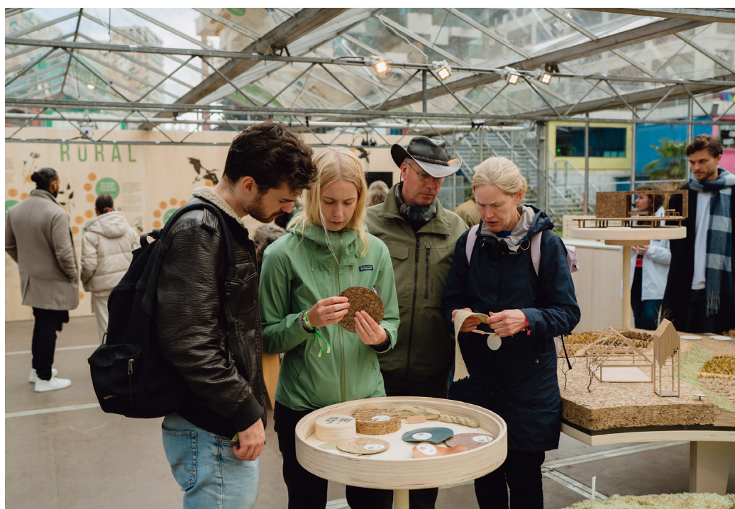
Embassy of Circular & Biobased Building

Onze wereld is grotendeels ontworpen, voor en door mensen. Om de uitdagingen waar we als maatschappij voor staan het hoofd te bieden, is stevig herontwerp nodig en een betrokken samenleving: gebruikers, makers van keuzes en medebepalers van beleid. De ontwerpers die hun werk tijdens DDW23 presenteerden, nodigden zichzelf en de bezoekers uit om zich te verbeteren. Hun werk varieerde van bemoedigende concepten tot kant-en-klare producten, en van toekomstbestendige mode en technologische innovatie tot direct toepasbaar social design.