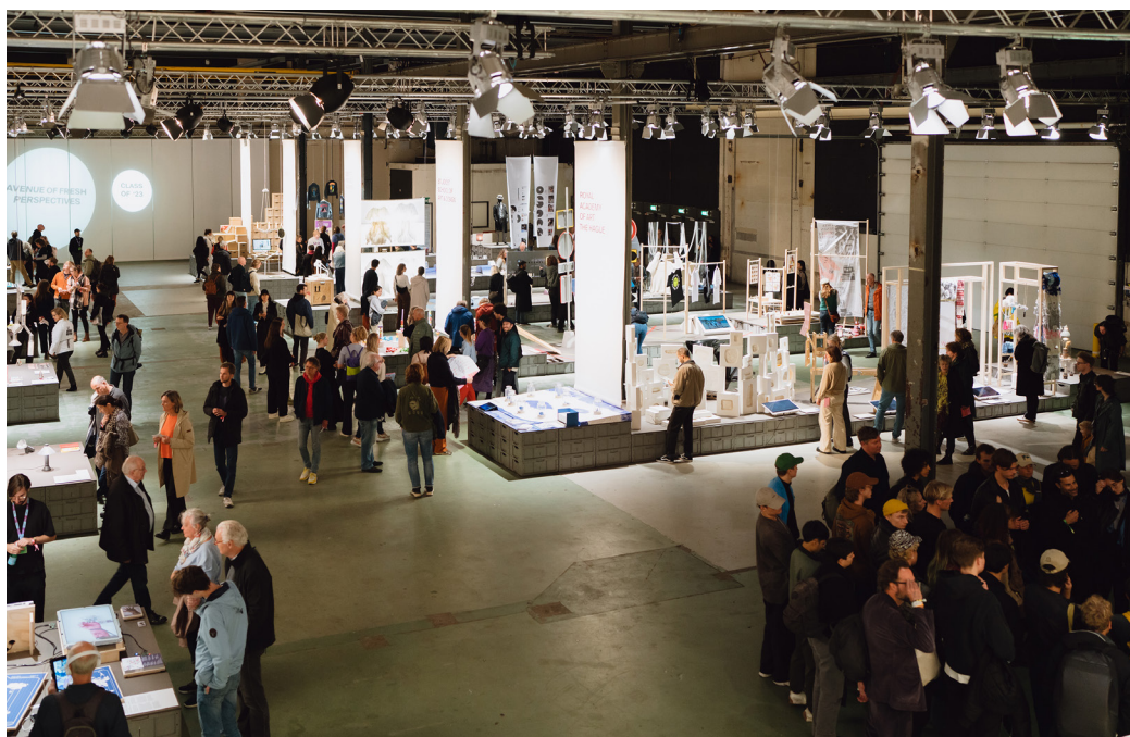
Class of '23, Klokgebouw

Elk van deze opleidingen toonde hun grootste talenten op een eigen catwalk. Op de kop van de catwalk presenteerden zij een zelf geselecteerd project dat volgens hen goed reflecteerde op de huidige tijdsgeschiedenis. Al deze projecten samen vormden een laan van vernieuwende perspectieven, de zogeheten 'Avenue of Fresh Perspectives', waar DDW-bezoekers doorheen konden wandelen om zich te laten inspireren door die frisse blikken.