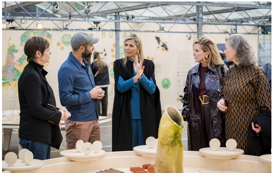
Koningin Máxima bezoekt DDW23, hier bij de Embassy of Circular & Biobased Building

Het programma World Design Embassies (WDE) zet ontwerpkracht in bij het ontwikkelen van nieuwe vergezichten en concrete oplossingsrichtingen voor maatschappelijke uitdagingen. In 2023 vormden partners uit het bedrijfsleven, (semi)overheid, kennisinstellingen, non-profitorganisaties en ontwerpers open coalities. Binnen die coalities werkten de partners samen aan oplossingsrichtingen van (inter)nationale transitie-opgaves. De resultaten werden tijdens DDW23 gepresenteerd aan het publiek in de vorm van exposities, lezingen, podcasts, conferenties, workshops en rondleidingen.